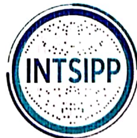
Secretario (a) General