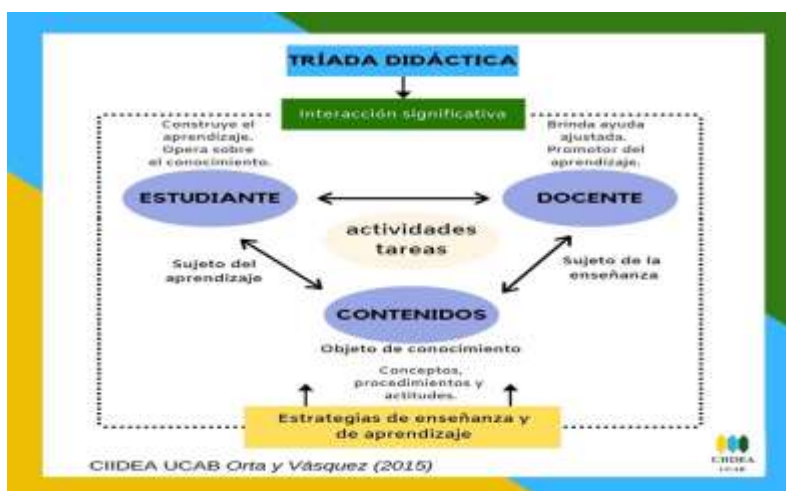
Ilustración 2. Triada didáctica

La fundamentación pedagógica es el tema central en esta propuesta, porque la educación tiene como pilar fundamental la pedagogía, misma que se efectiviza a través de la didáctica, puede aterrizar en el proceso de enseñanza aprendizaje, involucrando la triada didáctica que se constituye con la integración de dos sujetos activos y un objeto que son: estudiante (construye su propio conocimiento), docente (promotor del aprendizaje) y contenidos (objeto de conocimiento).