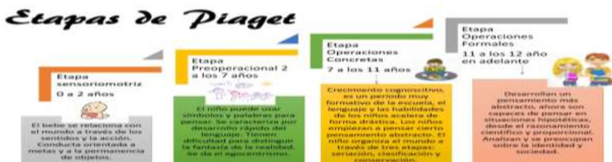
Ilustración 1. Etapas según Piaget

A través de los fundamentos psicológicos aplicados en el proceso educativo se sostiene la labor docente, en cuanto al desarrollo cognitivo y de la personalidad, enfatizando también el desarrollo emocional y sus implicaciones en la educación, que dependiendo del nivel y subnivel educativo se considera el desarrollo psicomotriz (mente-cuerpo) que implica articular conscientemente un conjunto de acciones que promuevan aprendizajes, generando ideas y actuando; asimismo este fundamento hará presencia en el desarrollo de la inteligencia, a través de la asimilación de objetos y eventos en los que interactúa; por otra parte, aporta en acciones socio afectivas vinculada con la personalidad, cooperación y vínculos emotivos. De acuerdo a la teoría de Jean Piaget tenemos la teoría de aprendizaje cognoscitivo que trata del aprendizaje según etapas entre la infancia y la adolescencia, clasificándolas en: sensoriomotor, preoperacional, operaciones concretas y operaciones formales, mismas que se detallan en la siguiente imagen.