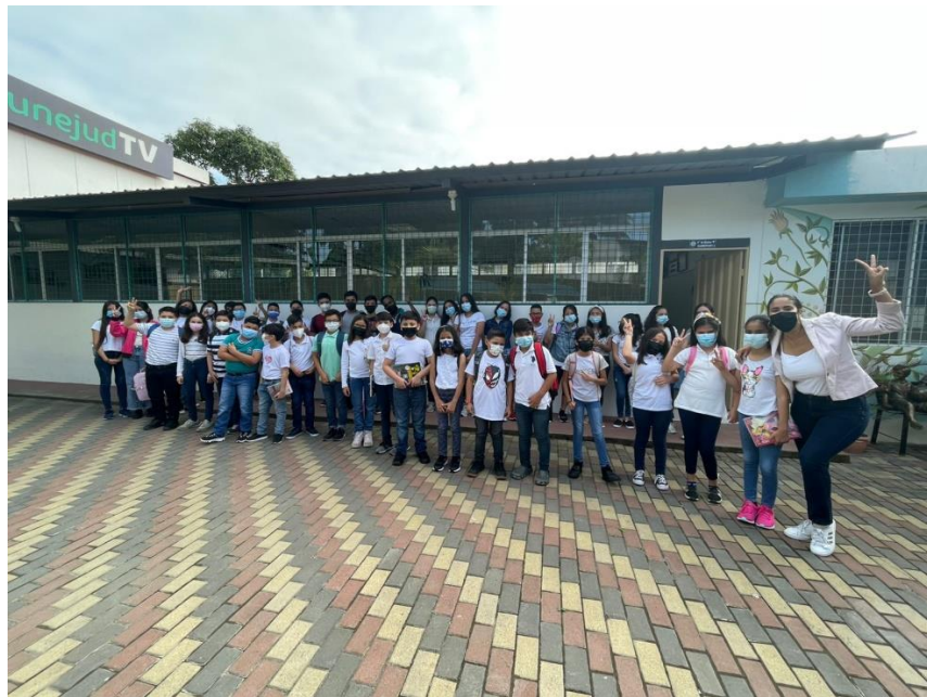
Clases Presenciales English Social Club